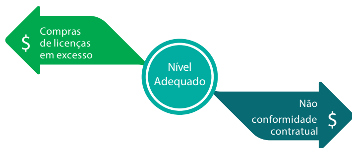
Figura 2. Entercompany e a Snow Software auxiliam as empresas a manter o equilíbrio na utilização das licenças de software, reduzindo tanto a quantidade de licenças compradas em excesso, como a quantidade de ativos fora de conformidade.

Gerenciamento proativo dos ativos de software com o intuito de melhorar a eficiência de sua utilização, reduzir custos e manter a conformidade contratual. Isso requer a realização de uma reconciliação das instalações de software no parque de TI (inventário) com os direitos de uso de licenças (compras) levando em consideração os acordos de licenciamento que determinam como o software pode ser instalado e utilizado.