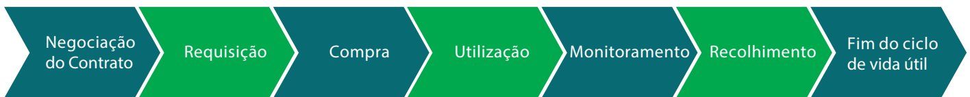
Figura 1. A Entercompany pode simplificar e otimizar os processos de SAM ao longo de todo o ciclo do software.

Software Asset Management [SAM] é um gerenciamento ativo da informação ao longo dos sete estágios do ciclo de vida do software – desde a negociação inicial do contrato até a baixa do software (figura 1). Frequentemente estes subprocessos individuais são executados por departamentos separados e são inconsistentes, desorganizados e desalinhados. A função da governança de SAM é justamente orquestrar as atividades e informações na empresa.